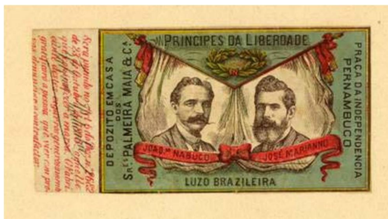
Figura 2 – Rótulo do cigarro com a imagem de Joaquim Nabuco e José Mariano, respectivamente.

Ainda neste contexto, têm-se como exemplo a marca de cigarro que traz no rótulo colocado mais abaixo os rostos de Joaquim Nabuco e José Mariano 5 indicando que quem comprasse esse cigarro consumiria mais do que nicotina para deleitar o paladar . A imagem presente no rótulo de cigarros diz, portanto, muito do ambiente político daquele final de século.